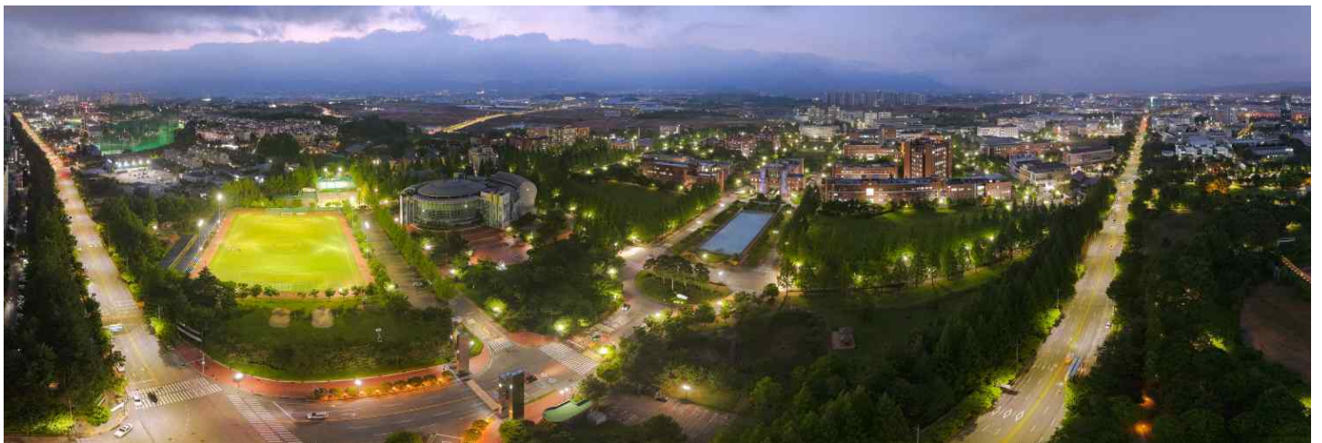
▲ GIST와 광주 첨단지구 일대 전경