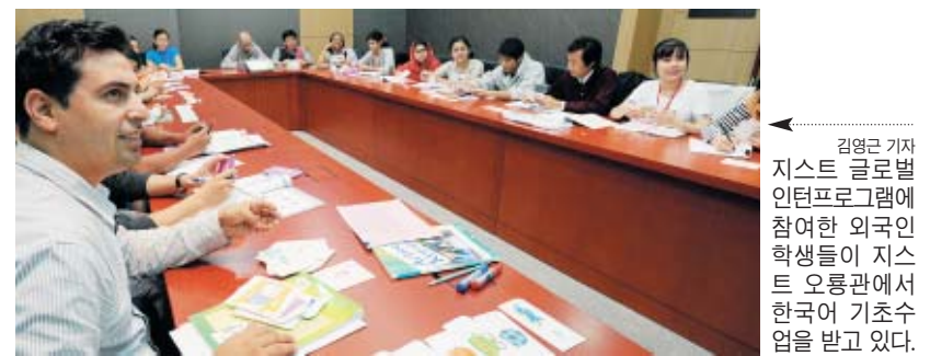
김영근 기자 지스트 글로벌 인턴프로그램에 참여한 외국인 학생들이 지스트 오픈관에서 한국어 기초수업을 받고 있다.

“지스트가 보내준 정수기는 이곳에서 구세주와 같습니다. 비록 우물이 하나이고 한정된 물이지만 한 대의 정수기로 하루 200명이 식수를 제공받고 있습니다. 수천명의 주민들이 식수로 사용하기는 역부족이지만, 어린이들과 학생들이 마음껏 물을 마실 수 있어 얼마나 다행인지 몰라요. ‘응달샘’이 척박한 땅 사람들의 생명을 구하길 바라며...” 권경안 기자 gkwon@chosun.com