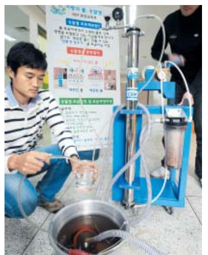
지스트 환경공학부 학생들이 특수정수기인 ‘응달샘’으로 휴탕물을 1급수로 정수하고 있다.