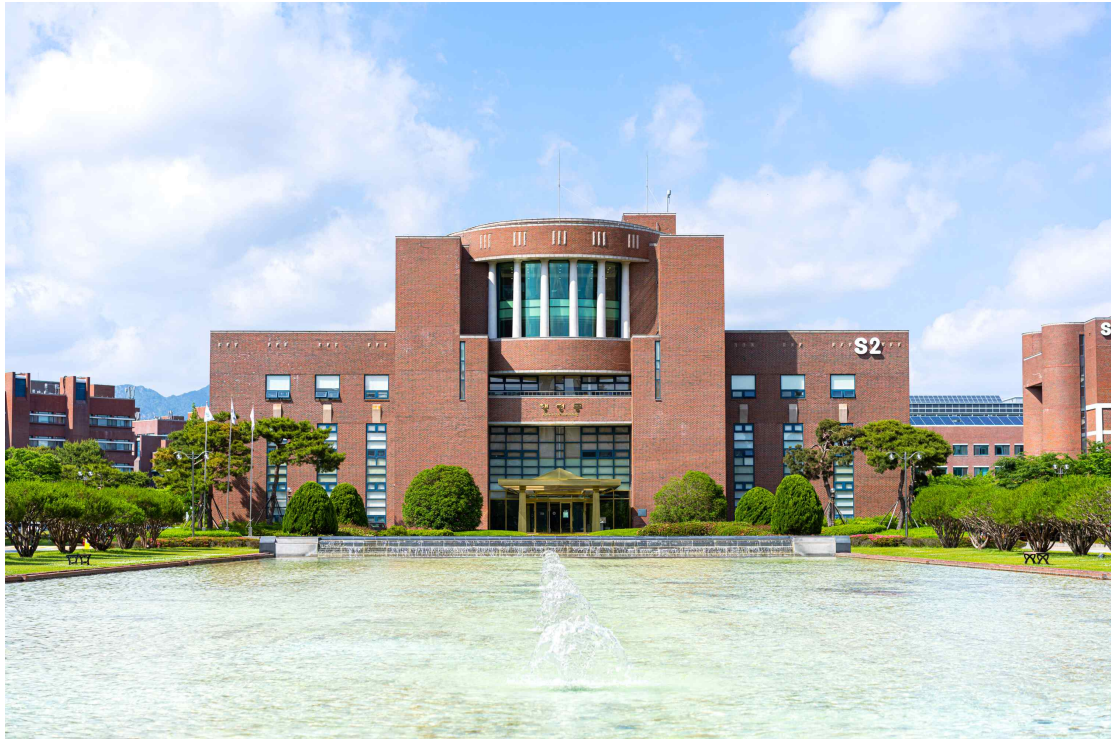
▲ 지스트 행정동 전경

- 신임 총장 후보자 모집 위한 초빙공고 게시...1월 16일~2월 5일 3주 간 지원서 접수